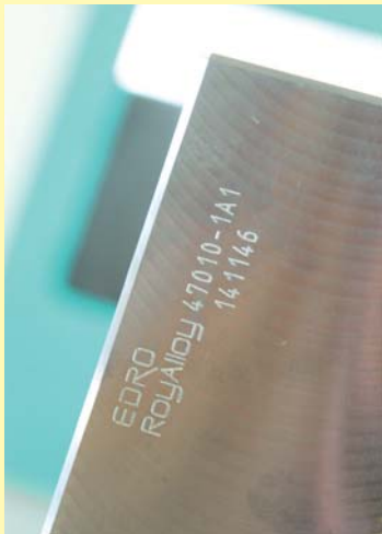
Gravur EDRO RoyAlloy Schmelz- und Kundenteile- Nummer

All diese Eigenschaften haben RoyAlloy™ zum Formaufbautenstahl Nr. 1 gemacht.