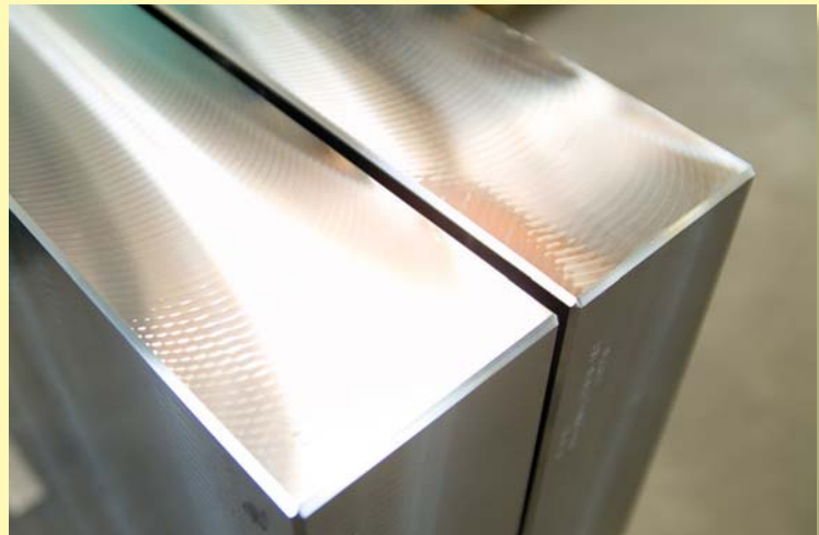
Erstklassige Oberflächen feinstgefräst